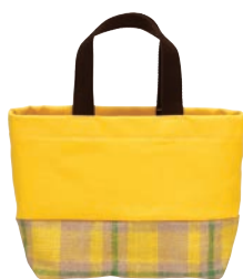
イエローチェック

ツートンカラーが とってもおしゃれ。 カラフルな12色の中 からお選びください。