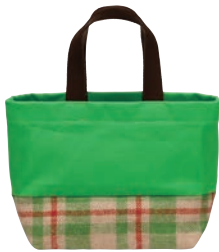
グリーンチェック