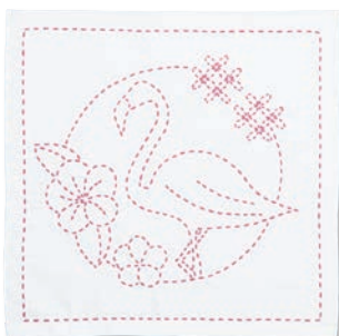
フラミンゴと変わり七宝 ●糸の色：ピンク