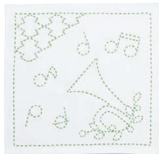
メロディと二重菱形つなぎ ●糸の色：黄緑