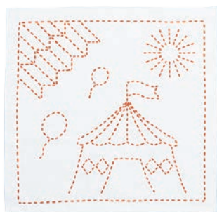
サーカスと矢羽根 ●糸の色：オレンジ