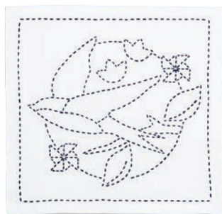
小鳥と風車 ●糸の色：紺