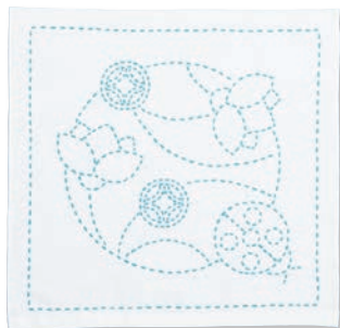
てんとう虫と丸七宝 ●糸の色：水色