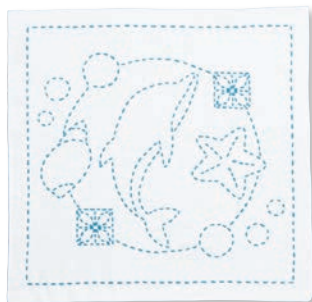
イルカと角七宝 ●糸の色：スカイブルー