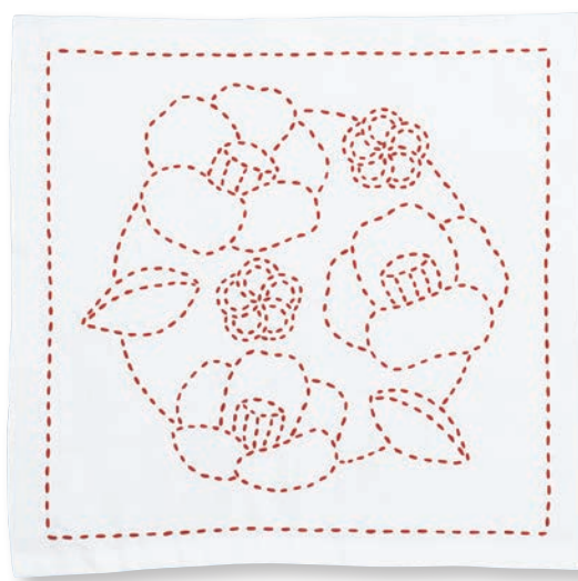
つばきとねじり蛇の目 ●糸の色：赤