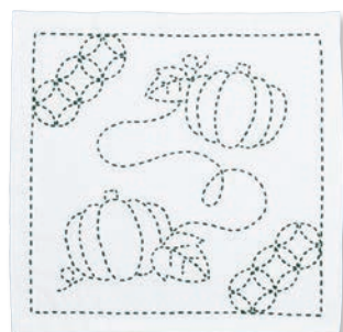
かぼちゃと七宝つなぎ ●糸の色：緑