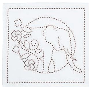
ゾウと変わり十の字 ●糸の色：茶