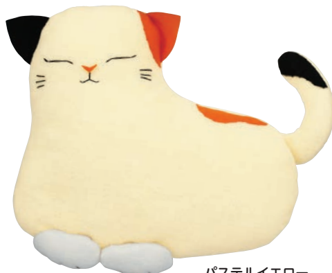
パステルイエロー