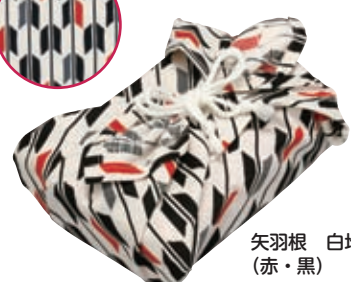
矢羽根 白地 (赤・黒)