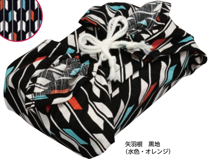
矢羽根 黒地 (水色・オレンジ)