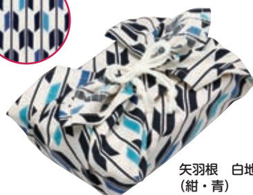
矢羽根 白地 (紺・青)