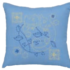
かくしっぽう カメレオンと角七宝 糸の色：黄色・青