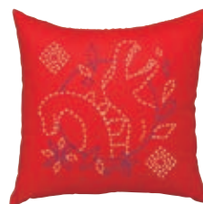
たてみす 恐竜と立三拵 糸の色：青・白