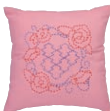
にじゅうひしがた バラと二重菱形つなぎ 糸の色：赤・青