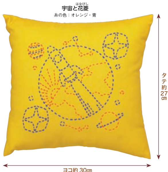
はなびし 宇宙と花菱 糸の色：オレンジ・青