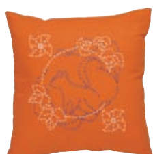
かざぐるま リスと風車 糸の色：白・青