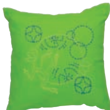
はなびし カエルと花菱 糸の色：黄色・青