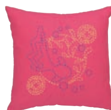
まるしっぽう 金魚と丸七宝 糸の色：黄色・青