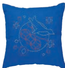
しっぽう ペンギンと七宝つなぎ 糸の色：黄・オレンジ