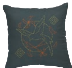
たてみす オナガドリと立三拵 糸の色：黄色・オレンジ