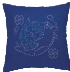
かじゅうじ シャチと変わり十の字 糸の色：水色・白