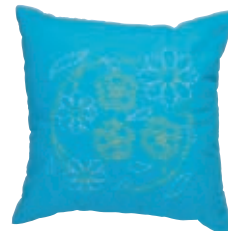
じやめ マーガレットとねじり蛇の目 糸の色：黄色・白