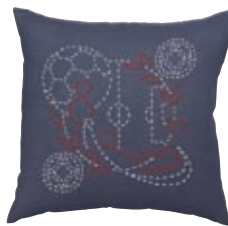
まるしっぽう サッカーと丸七宝 糸の色：赤・白