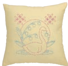
か しっぽう 白鳥と変わり七宝 糸の色：ピンク・水色