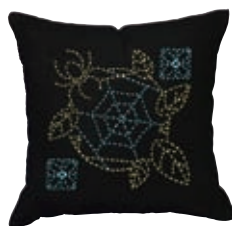
かくしっぽう クモと角七宝 糸の色：黄色・水色