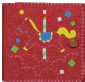
レッド 糸の色：ピンク