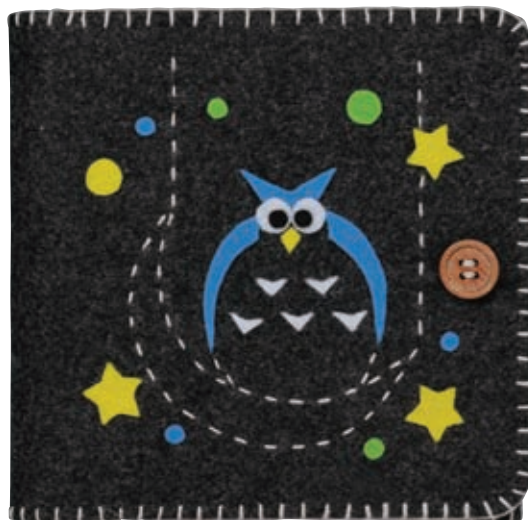
ブラック 糸の色：ベージュ