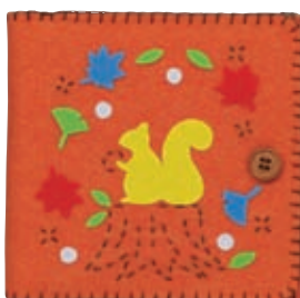
オレンジ 糸の色：茶