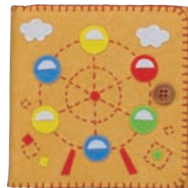
イエロー 糸の色：赤