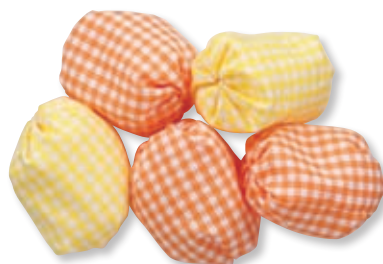
オレンジ×イエロー