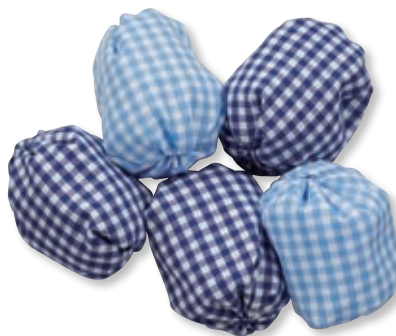
ブルー×パステルブルー