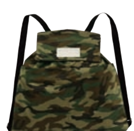
150 サファリグリーン