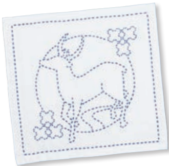
トナカイと十字つなぎ ●糸の色：青