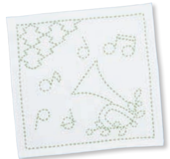
メロディと二重菱形つなぎ ●糸の色：黄緑