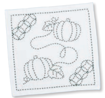
かぼちゃと七宝つなぎ ●糸の色：緑