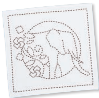
ゾウと変わり十字 ●糸の色：茶