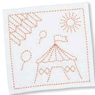
サーカスと矢羽根 ●糸の色：オレンジ