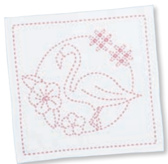
フラミンゴと変わり七宝 ●糸の色：ピンク