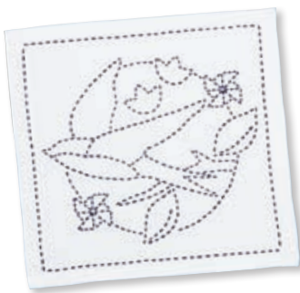
小鳥と風車 ●糸の色：紺