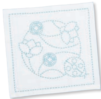
てんとう虫と丸七宝 ●糸の色：水色