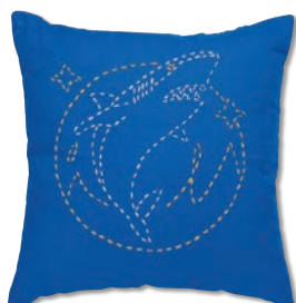
ジョーズと海 糸の色：白・黄