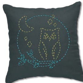
夜のふくろう 糸の色：黄・水色