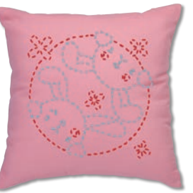
うさぎのかくれんぼ 糸の色：水色・赤