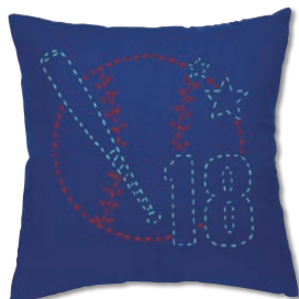
ベースボール 糸の色：赤・水色