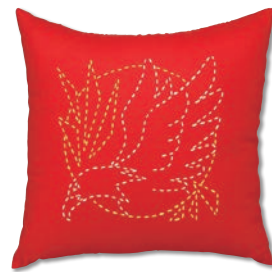
イーグル 糸の色：白・黄