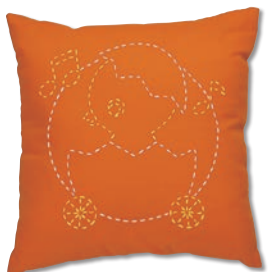
ひよこパレード 糸の色：白・黄