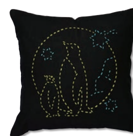
ペンギンのおやこ 糸の色：黄・水色