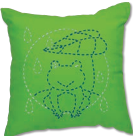
かえるの雨やどり 糸の色：青・白