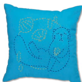
ラッコのおうち 糸の色：青・黄