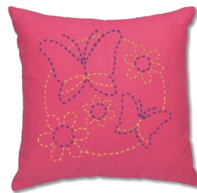
ちょうちとお花 糸の色：青・黄