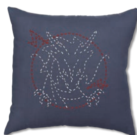
ドラゴン 糸の色：白・赤