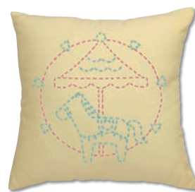
メリーゴーランド 糸の色：水色・ピンク