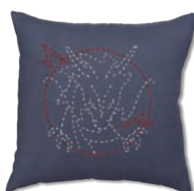
ドラゴン 糸の色：白・赤