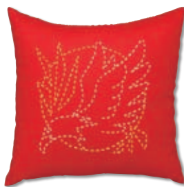
イーグル 糸の色：白・黄