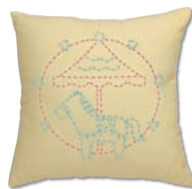
メリーゴーランド 糸の色：水色・ピンク