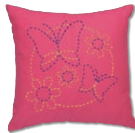
ちょうちとお花 糸の色：青・黄