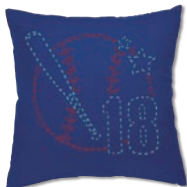
ベースボール 糸の色：赤・水色