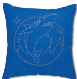
ジョーズと海 糸の色：白・黄