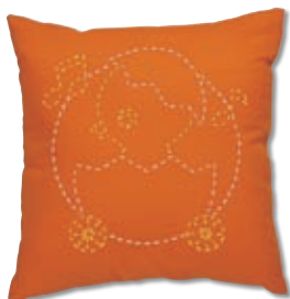
ひよこパレード 糸の色：白・黄