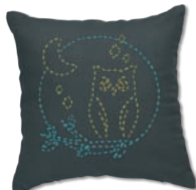
夜のふくろう 糸の色：黄・水色