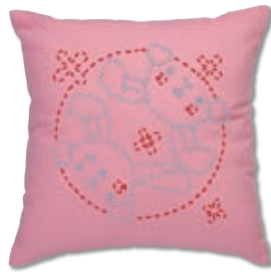
うさぎのかくれんぼ 糸の色：水色・赤