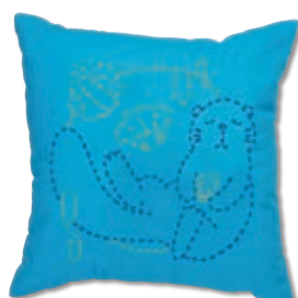
ラッコのおうち 糸の色：青・黄