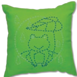
かえるの雨やどり 糸の色：青・白