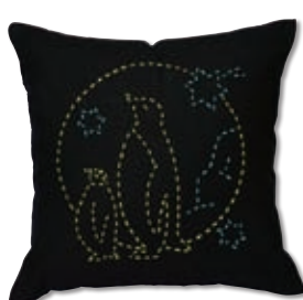
ペンギンのおやこ 糸の色：黄・水色